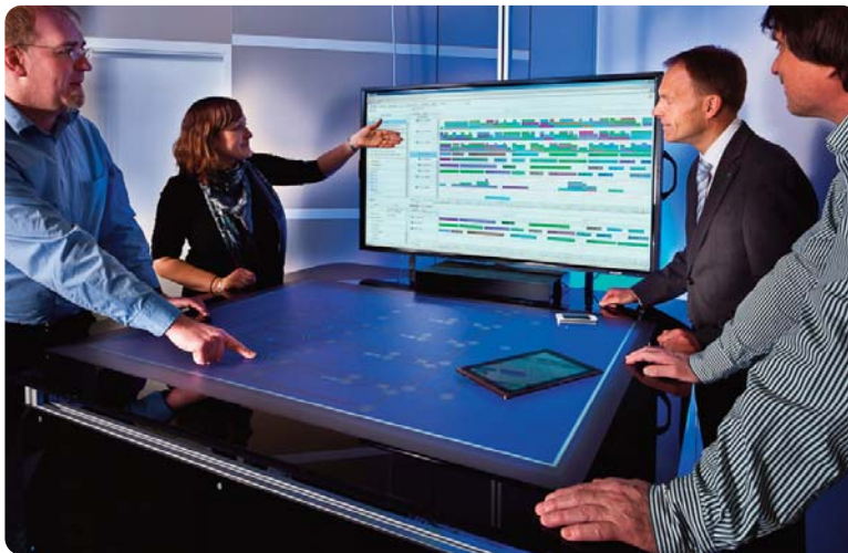
Bild 2: DigET – interaktive Arbeitsumgebung für das Multi-User-Engineering