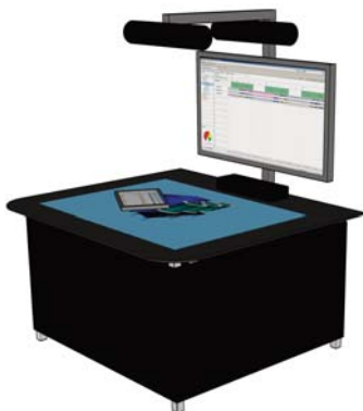
Bild 3: Hardware-Komponenten der DigET-Umgebung und deren Anordnung

Die durchgängige Kommunikation und Datenhaltung über Nutzer und Tools